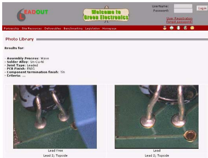
Fig. 1 – Imagem Ilustrativa de um Resultado

O sistema apresenta as imagens, para uma dada combinação seleccionada, no caso de juntas Sem Chumbo e de Com Chumbo (Fig.1). Na Base de Dados LEADOUT existem imagens de juntas Sem Chumbo, Com Chumbo, Conformes, Defeituosas, etc.