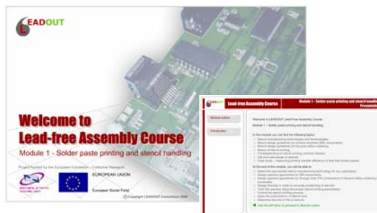
Formato “e-learning” (Aprendizagem Electrónica)

No curso de “e-learning” (aprendizagem electrónica), no fim de cada sessão, há um questionário de avaliação. Para um utilizador passar para a lição seguinte tem de atingir uma determinada classificação pois, caso contrário, tem de repetir a lição. A classificação mínima a obter não é sempre a mesma nem directamente dependente do número e tipo de perguntas. Nesta plataforma de “e-learning” (aprendizagem electrónica) também existe um relatório do curso no qual o utilizador pode facilmente verificar o seu progresso e os resultados alcançados.